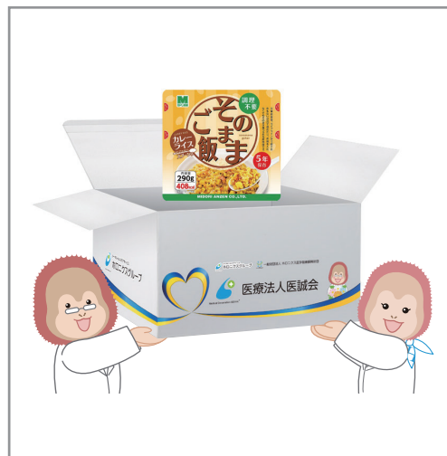
支援物資（パウチ型保存食）

ホロニクスグループでは、ウクライナ支援に賛同した職員から募金活動の声があがり支援募金を実施します