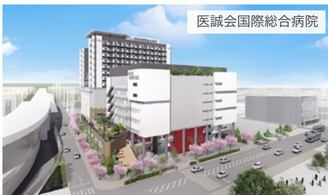
医誠会国際総合病院

ご参考動画:2022年4月28日 巣箱開放 【URL】 https://youtu.be/vijGpv94JOE