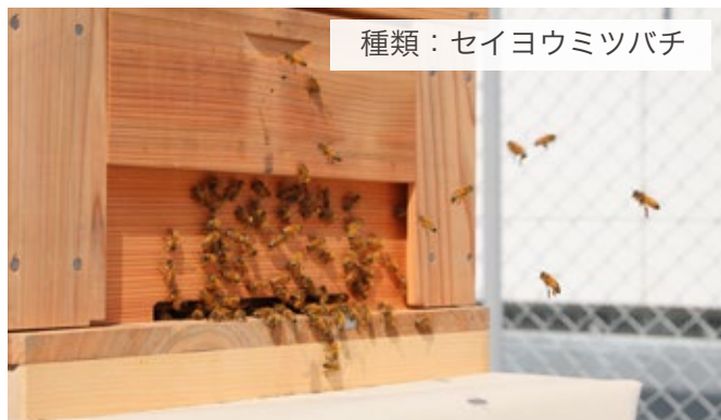
種類:セイヨウミツバチ

今回、大阪初となる病院屋上での都市養蜂を茨木医誠会病院の屋上から始動させました。2023年10月開設の医誠会国際総合病院(大阪市北区扇町)屋上での都市養蜂に向けて知識・経験・ノウハウを蓄積し本格始動に臨みます。まもなく!6月下旬から7月初旬、はじめての採蜜作業に期待が膨らんでいます。本事業は、ホロニクスグループが取り組むSDGsチャレンジプロジェクトの1つであり、SDGsの達成への貢献という側面も併せもつ事業です。