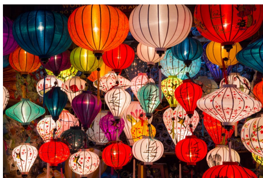
ランタン設置イメージ