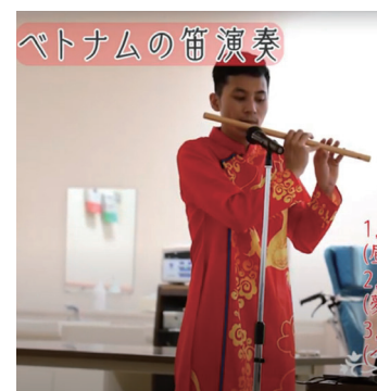
第1回開催動画より